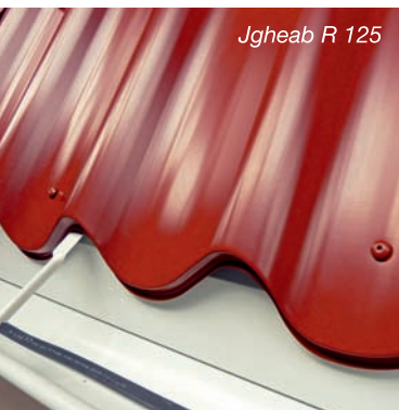
Jgheab R 125